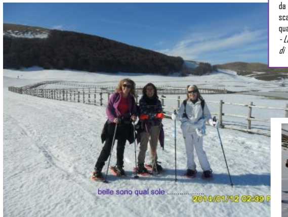
belle sono qual sole ..... 2014/01/12 02:39 F

da SER Folignano (pgc) su base IGM scala originaria: 1:25000 (lato di un quadrato = Km 1,00); Ridis. F. Parzi - Le foto ai Pantani di Accumoli e in Val di Canatra sono di F.Parzi.